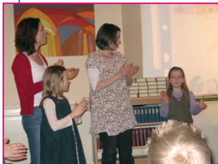
Musik og sang til fredagsfamilie