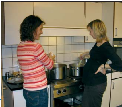
Aftensmaden lørdag aften bliver forberedt

Indtryk fra Kirkefællesskabs-lejr i Hammer Bakker