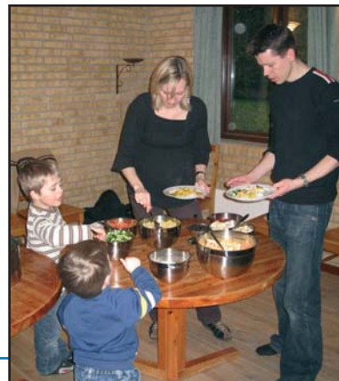
- og den bliver nydt i fællesskab