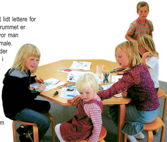
Børnehjørnet i Kirken

I løbet af ugen har vi mange aktiviteter for børn: legestue, babysalmesang, børneklub osv, som der kan læses om andet sted i bladet.