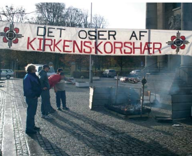
Helstegt pattegris foran Ansgars Kirken

Jeg ser frem til mere tid til engagementet i menighedsrådet, hvor der er støtte og velvilje omkring korshærens liv i huset.