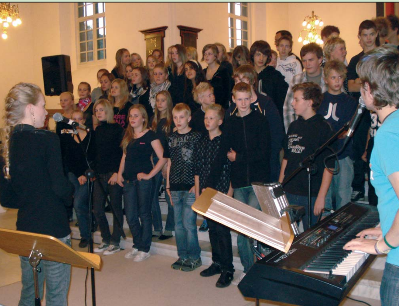
Gospeldag med konfirmander i Ansgars Kirken

1. december 2007 - 29. februar 2008 - 79. årgang nr. 4