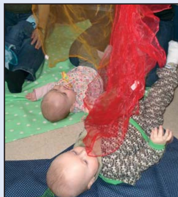
Babysalmesang i Ansgars Kirken