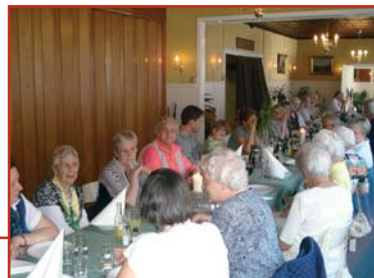
Middag på Dybvad Kro