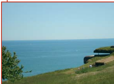
Ved Frederikshavn Fortet

Sommerudflugten gik til Frederikshavn. Undervejs spiste vi på Dybvad Kro og drak kaffe i Møllehuset i Frederikshavn. Vi så Bangsbo Museet og nogle deltog også på Historiens dag på Frederikshavn Fortet.