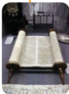
Torah-rulle indeholdende Loven