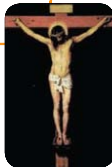
Den korsfæstede Jesus